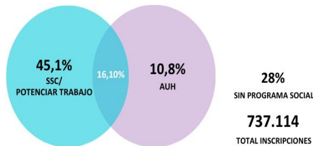
Gráfico 2. Inscripciones a Programas Sociales, distribución porcentual Julio 2020-Agosto 2021. (Universo: total de inscriptos/as en la rama de Servicios Socio Comunitarios)