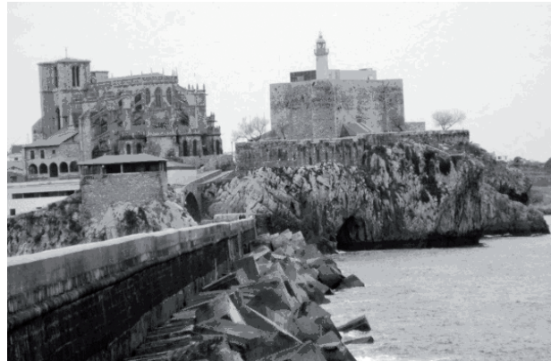
Los símbolos del “universo urbano” de Castro Urdiales. Al fondo de la imagen la Iglesia de Santa María (S. XIII) de arquitectura gótica evidencia el poder económico que alcanzó la villa durante la Edad Media. A su lado la capilla de Santa Catalina (S. XV) de estilo románico. Al margen derecho la fortaleza (S. XV) con el faro emplazado en el siglo XVIII. En la parte inferior del conjunto arquitectónico la llamada Ermita de Santa Ana (S. XV) la cual manifiesta la vocación marinera de la villa, ambas partes unidas por el Puente Medieval de arco simple (Fotografía del autor).

4- Si el “universo urbano” se distingue, como hemos dicho, por ser centro de relaciones comerciales y productivas diversificadas, también lo es por la variedad de actividades sociales, administrativas y religiosas que sustentan sus habitantes. Las villas no congregan solamente la sociabilidad de las familias acomodadas, sino también contienen las estructuras institucionales de la administración política y fiscal, así como de las jerarquías eclesiásticas, del ejército y de la Marinería. Esto permite que se constituya en un espacio de consumo sofisticado y diferenciado frente al entorno rural en que se encuentra enclavada. 24