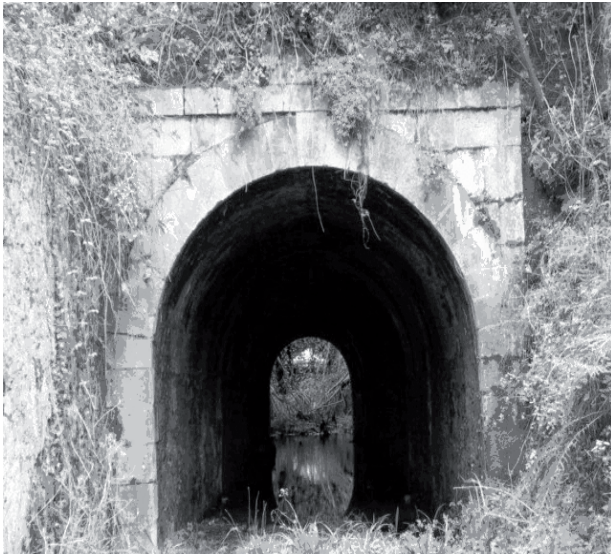
Restos de una de las puertas del antiguo recinto amurallado de la Villa de Castro Urdiales (Fotografía del autor).

3- Todo “universo urbano” desarrolla una espacialidad diferenciadora respecto del territorio que le circunda. Es por ello que los edificios, tanto públicos, sacros como privados, participan en la jerarquización del espacio urbano. Las calles, los espacios de reunión y toda la arquitectura de la villa son manifestaciones simbólicas de prácticas de sociabilidad diferenciadas de su entorno rural. 21 Son manifestaciones de esta espacialidad pública, por ejemplo, el puerto -al que ya encontramos mencionado en las primeras alusiones documentales dado el carácter marítimo por excelencia del emplazamiento- 22 , o bien el símbolo de su defensa más allá de las murallas, es decir el Castillo de la villa, asentado en la peña más abrupta y adentrada en el mar, siendo así el primer punto identificatorio del poblado divisado desde éste. Frente a él, y en un pequeño promontorio al que se accede por unos puentes o arcos, se construyó la ermita de Santa Ana, como manifestación clara del desarrollo de una espacialidad religiosa, que otorgaba a la villa su figura característica. En cuanto ejemplo propio de una espacialidad privada diferenciadora propia del “universo urbano”, podemos nombrar a las casas y sus torres fuertes construidas de piedra y madera por las elites dominantes locales como manifestación de su poder y riqueza, así como rasgo distintivo de la jerarquización